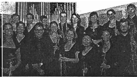
Spitzensembles: Das Collegium musicum aus Den Haag.

■ Lichtenau-Dalheim (NW). 15 Jahre Dalheimer Sommer, 100 Jahre Hugo von Hofmannsthal's „Jedermann“: Die aktuelle Dalheimer Festivalsaison gibt allen Grund zum Feiern. Premiere im Neuen Schafstall ist am Freitag, 29. Juli. Kurz darauf am Sonntag, 31. Juli, starten die Dalheimer Tage alter Musik mit dem Collegium musicum aus Den Haag.